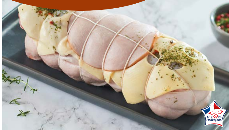
PORC FILET MIGNON ORLOFF (n)