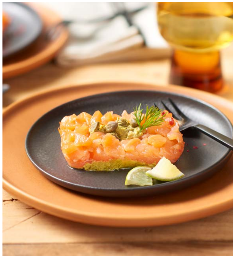
TARTARE DE SAUMON ASPERGES VERTES ET CÂPRES (m) CARREFOUR LE MARCHÉ

La barquette de 130 g. Soit le kg : 38,46 € Au rayon Poissonnerie libre-service