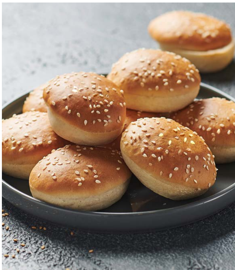
MINI PAIN BURGER (m)

La pièce de 375 g. Soit le kg : 16 € Au rayon Traiteur à la coupe