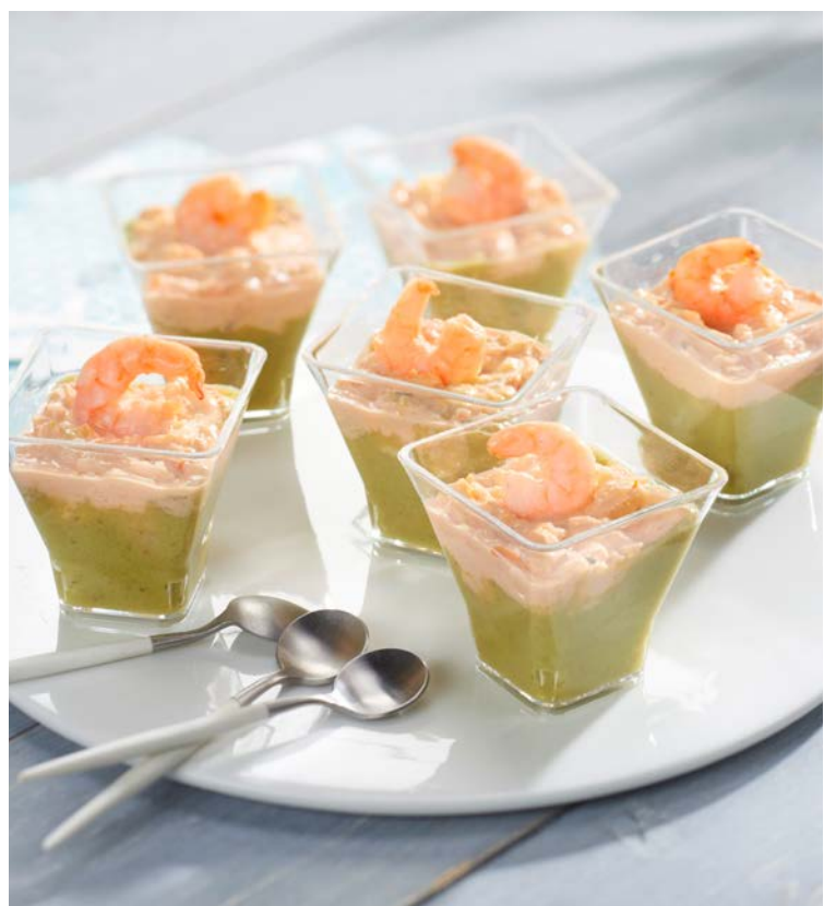
6 VERRINES AVOCAT ET COCKTAIL DE CREVETTES (m)

La barquette de 100 g. Soit le kg : 59 € Au rayon Poissonnerie libre-service