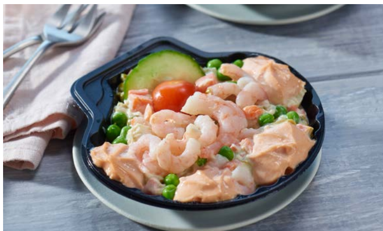
COQUILLE AUX CREVETTES (m)

La pièce de 65 g. Soit le kg : 30,77 € Au rayon Traiteur à la coupe