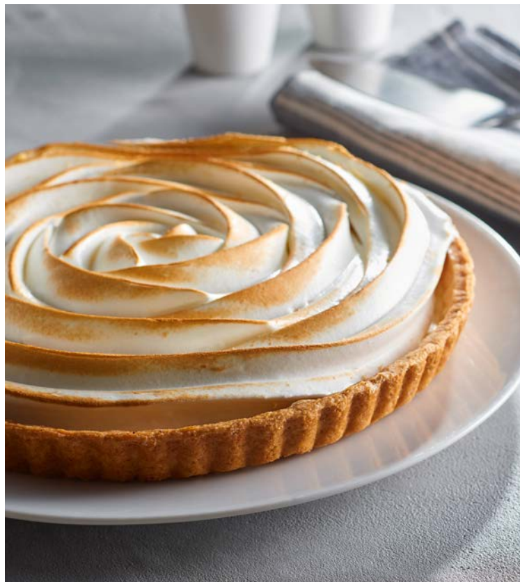
TARTE CITRON MERINGUÉE 6 PARTS (m)

La pièce de 780 g. Produit décongelé selon les techniques appropriées. Ne pas recongeler. Soit le kg : 10,51 € Au rayon Boulangerie-pâtisserie