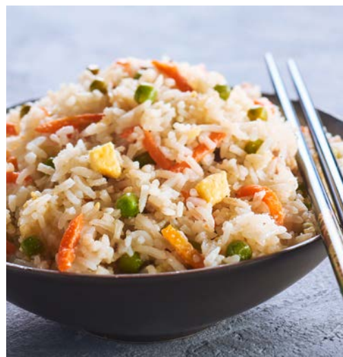
RIZ CANTONAIS (m)