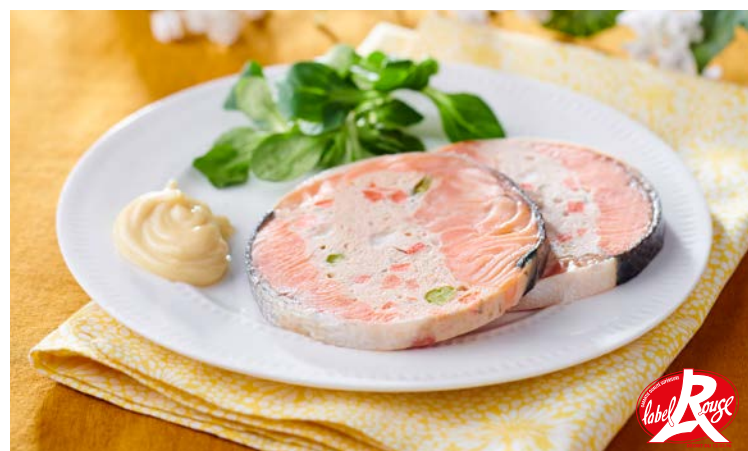
2 DARNES DE SAUMON FARCI LABEL ROUGE (m)

La pièce de 150 g. Soit le kg : 16,67 € Au rayon Traiteur à la coupe