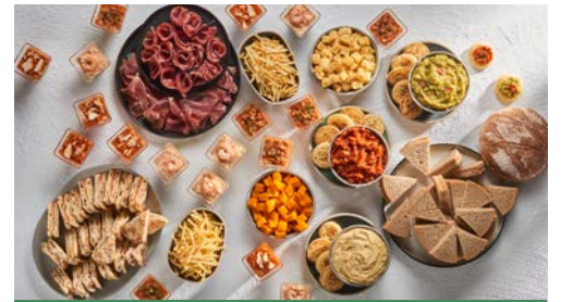
LES FORMULES PAGES 9 à 15