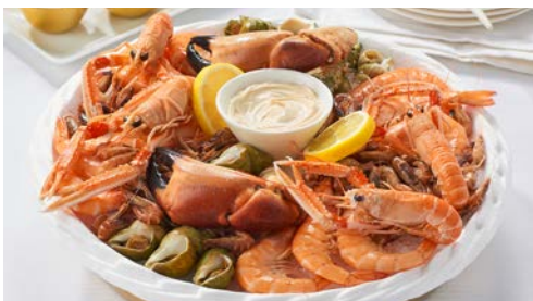
LES FRUITS DE MER PAGES 16 à 18