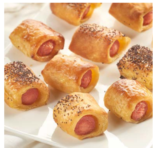
16 FEUILLETÉS SAUCISSES (m)

La barquette de 375 g. Soit le kg : 34,40 €