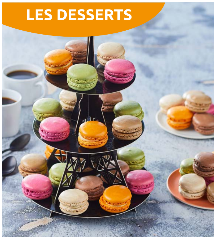
MACARONS AVEC SUPPORT TOUR EIFFEL (m)