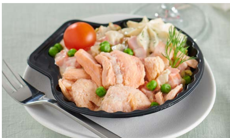
COQUILLE AU SAUMON

La pièce de 90 g. Soit le kg : 14,44 € Existe aussi en Aspic œuf dur au jambon à 0,90€ la pièce Au rayon Traiteur à la coupe