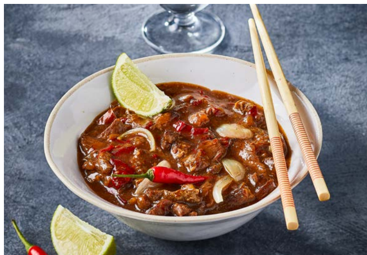
BOEUF AUX OIGNONS (m)

Soit le kg : 14 € Au rayon Traiteur à la coupe