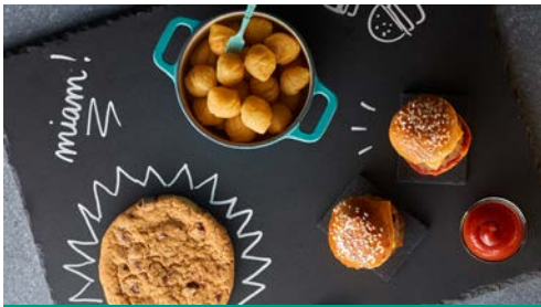
LES MENUS PAGE 4