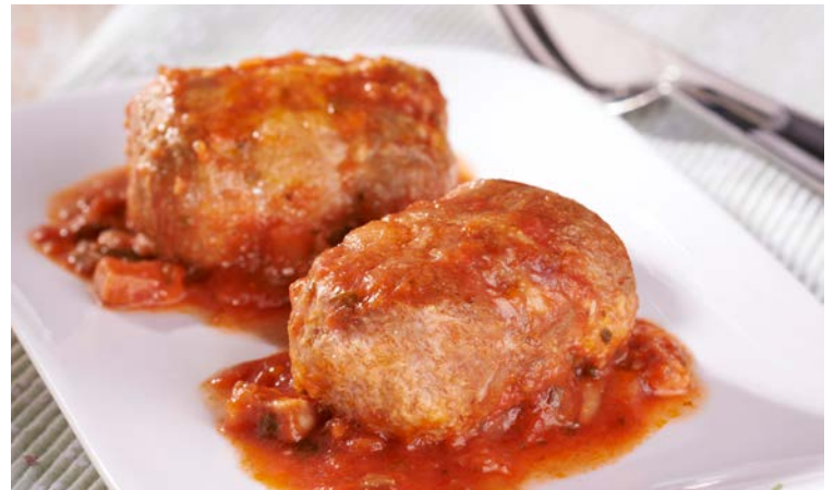
PAUPIETTE DE VEAU À LA SAUCE TOMATE (m)