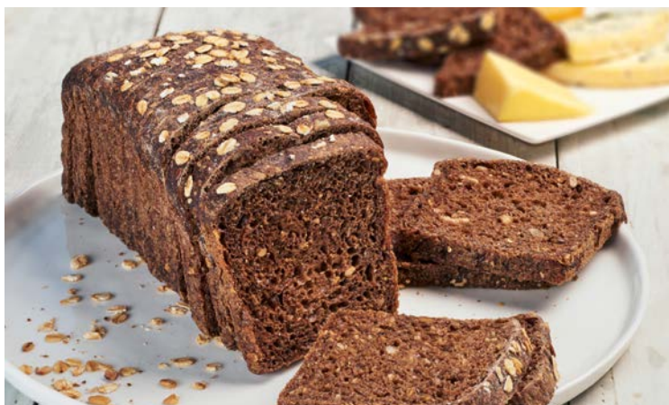
PAIN NORDIQUE (n)

La pièce de 300 g. Soit le kg : 5,67 € Au rayon Boulangerie-pâtisserie