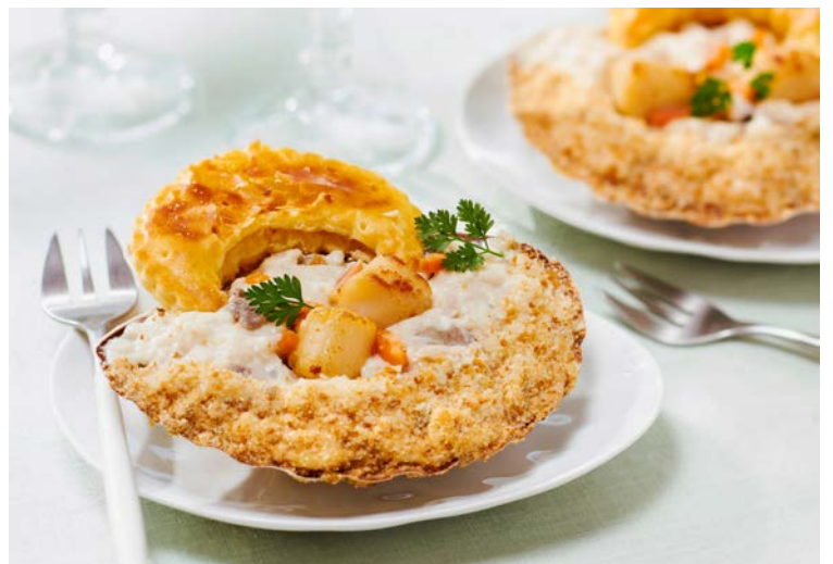
COQUILLE ST JACQUES À LA NORMANDE (n)

La pièce de 140 g. * Placopecten magellanicus origine Canada Soit le kg : 46,43 €