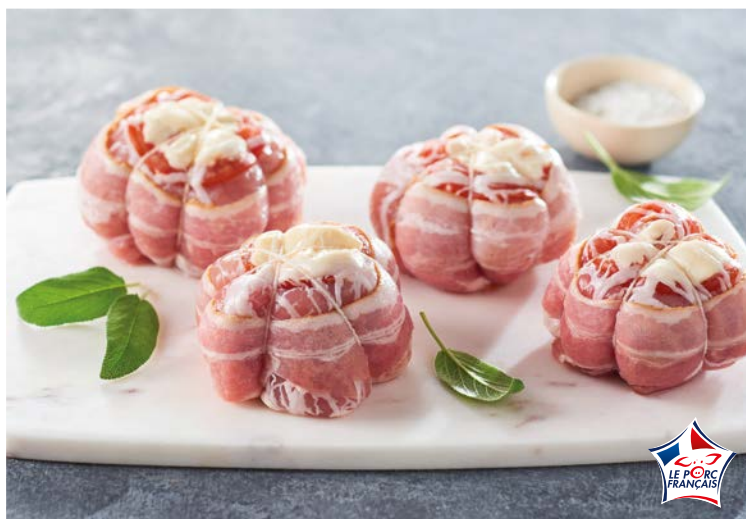
PAUPIETTE DE PORC FROMAGE TOMATE (m)