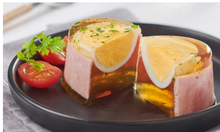
ASPIC ŒUF MOLLET JAMBON (n)

La pièce de 150 g. Soit le kg : 16,67 € Existe aussi en Coquille au surimi Au rayon Traiteur à la coupe