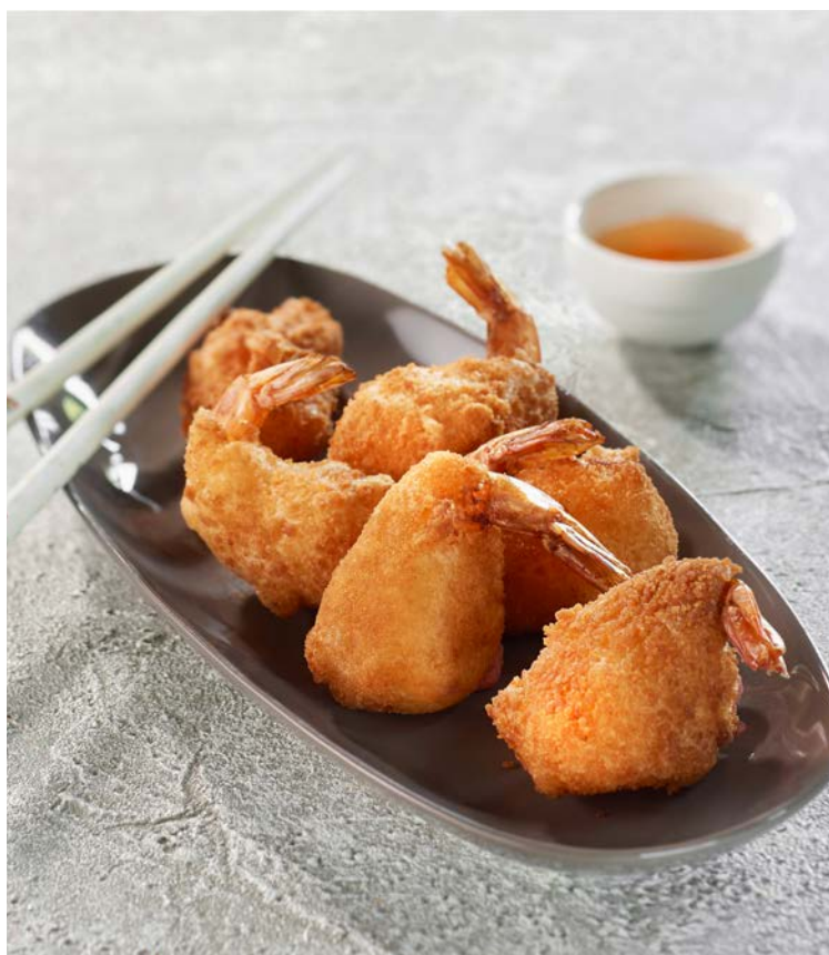
BEIGNET DE CREVETTE (m)

La pièce de 70 g. Soit le kg : 0,02 € Au rayon Traiteur à la coupe