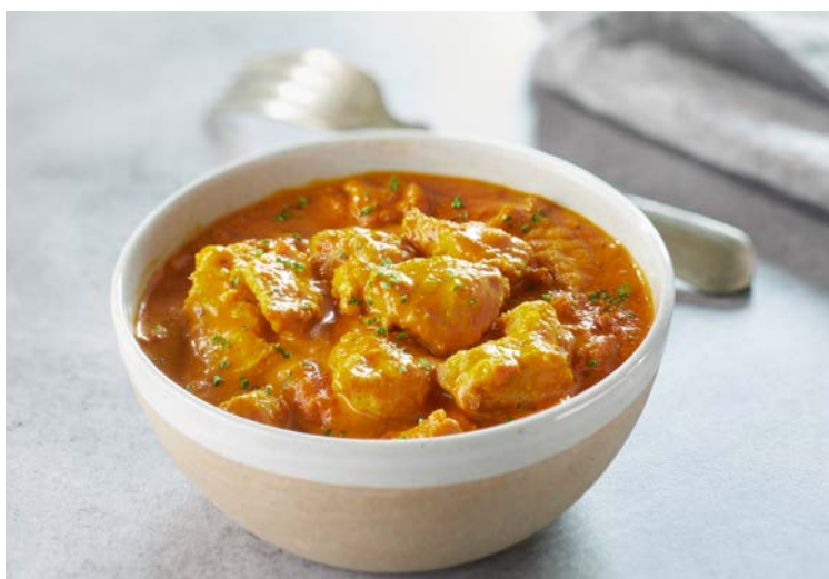
POULET KORMA (n)

Soit le kg : 16,90 € Au rayon Traiteur à la coupe