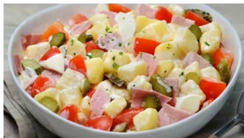
LES SALADES PAGE 19