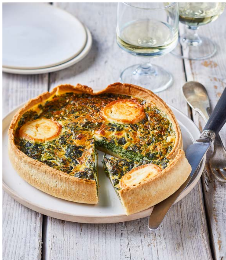
QUICHE CHÈVRE ÉPINARD (n)

La pièce de 1 kg. Soit le kg : 11,90 € Existe aussi en Pizza Capricciosa, Diavola ou 4 Fromages Au rayon Traiteur à la coupe