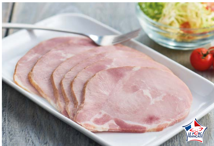
PLATEAU DE RÔTI DE PORC CUIT (n)

Composée de 1 part de poulet* certifié rôti 1/6ème 2 tranches de rôti de bœuf froid La tranche de 40 g environ, 1 morceau de jambonneau cuit nature ou pané 125 g environ. *Elevé dans le cadre du bien être animal.