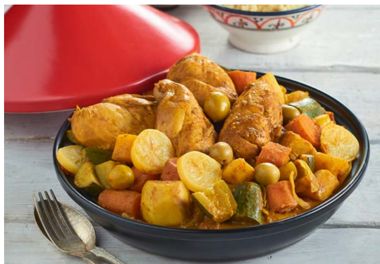
TAJINE D'AGNEAU AUX PRUNEAUX ET AMANDES (n)

Soit le kg : 12 € Au rayon Traiteur à la coupe