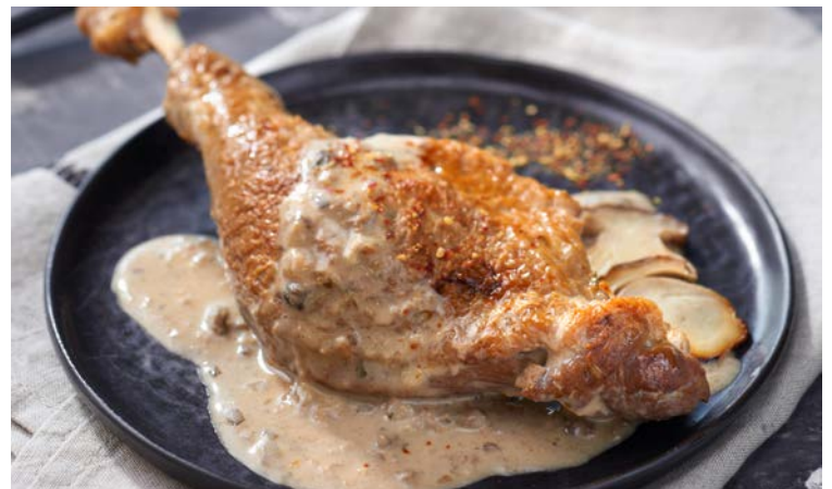
CUISSE DE CANETTE AUX CÈPES