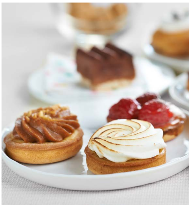
PETITS FOURS (m)

Le lot de 16 pièces - 420 g. Produit décongelé selon les techniques appropriées. Ne pas recongeler. Soit le kg : 18,93 € Au rayon Boulangerie-pâtisserie