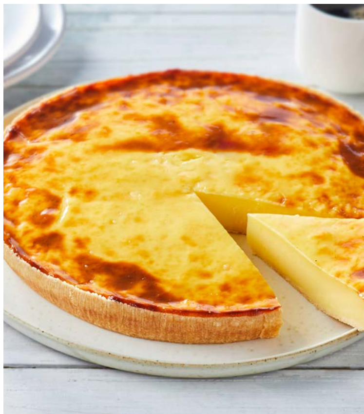
FAN NATURE 8/10 PARTS

La pièce de 670 g. Soit le kg : 9,55 € Au rayon Boulangerie-pâtisserie