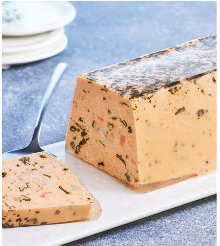
TERRINE DE SAUMON (n)

Soit le kg : 14,50 € Au rayon Traiteur à la coupe