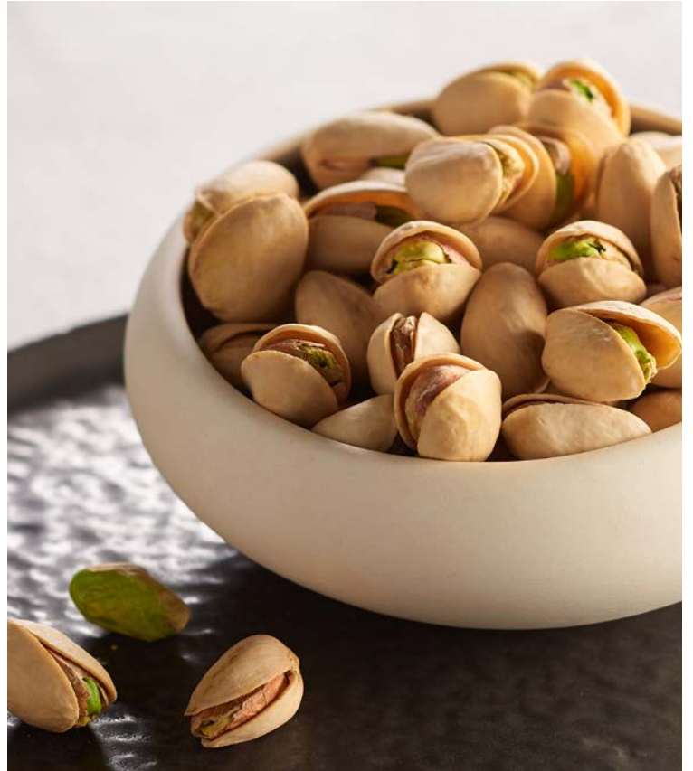
PISTACHES NATURES (n) WONDERFUL

Le sachet de 200 g. Soit le kg : 12 € Au rayon Fruits & légumes