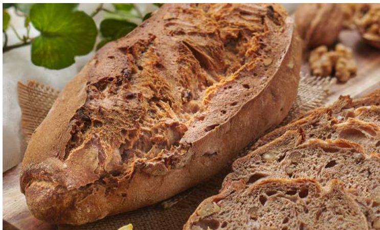
PAIN DE CAMPAGNE AUX NOIX (n)