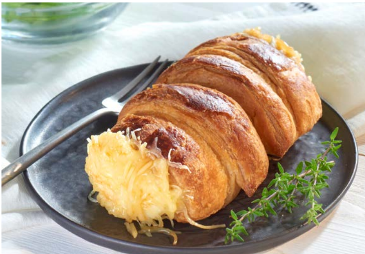
ROULÉ AUX TROIS FROMAGES (n)

La pièce de 200 g. Soit le kg : 23,50 € Au rayon Traiteur à la coupe