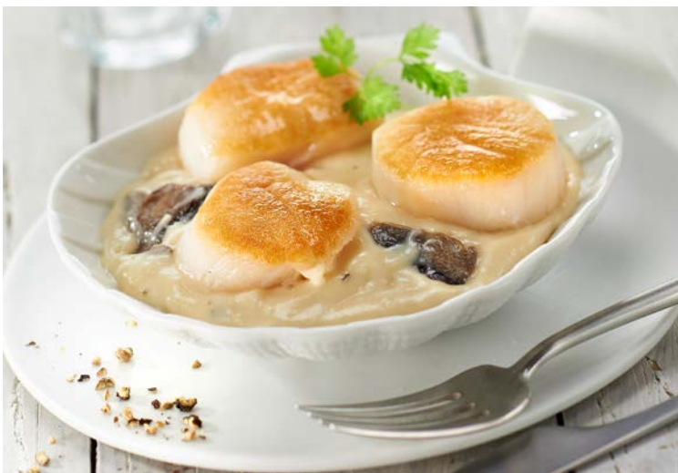
NOIX DE SAINT-JACQUES*** RÔTIES À LA SAUCE CHABLIS (n)