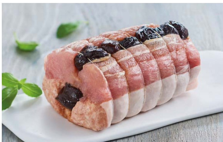
RÔTI DE PORC AUX PRUNEAUX *(m)