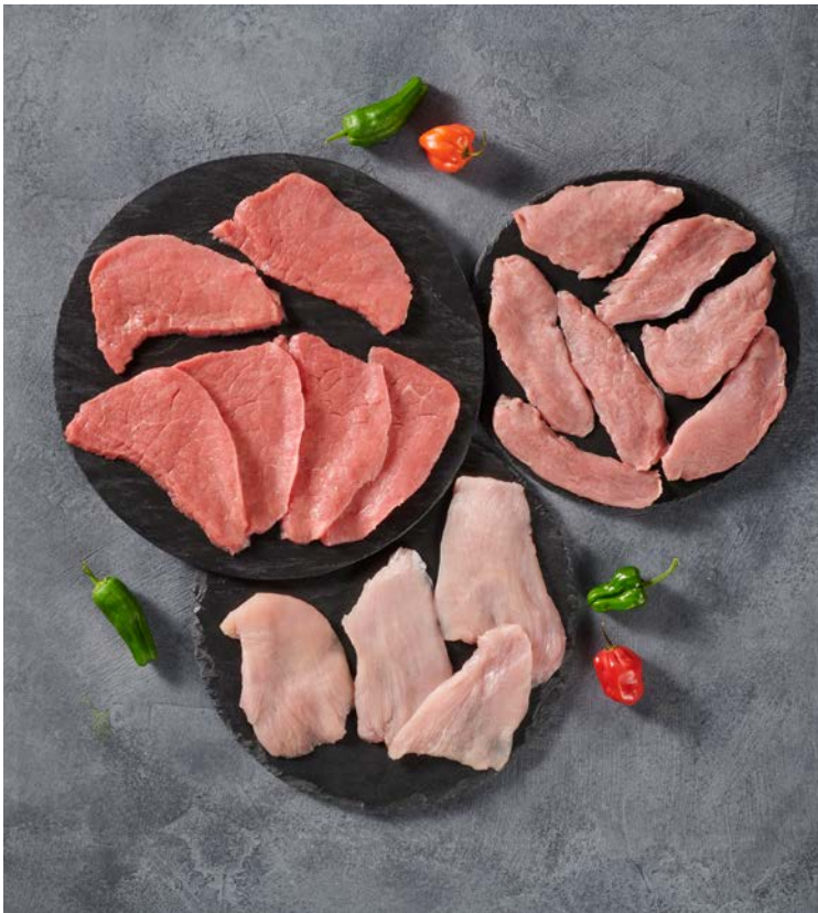
ASSORTIMENT POUR PIERRE À GRILLER CLASSIQUE POUR 4 PERSONNES. (n)