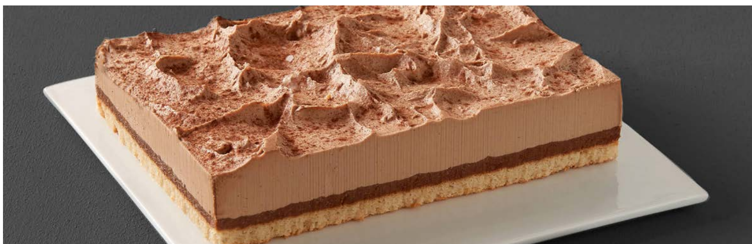
CROUSTILLANT CHOCOLAT 6/8 PARTS

La pièce de 500 g. Produit décongelé selon les techniques appropriées. Ne pas recongeler. Soit le kg : 17,40 € Au rayon Boulangerie-pâtisserie