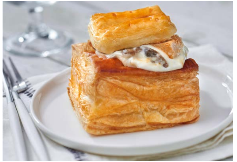
BOUCHÉE RIS DE VEAU (m)