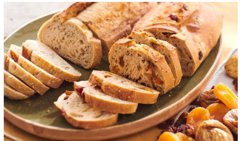
PAIN AUX CÉRÉALES ET FRUITS (n)