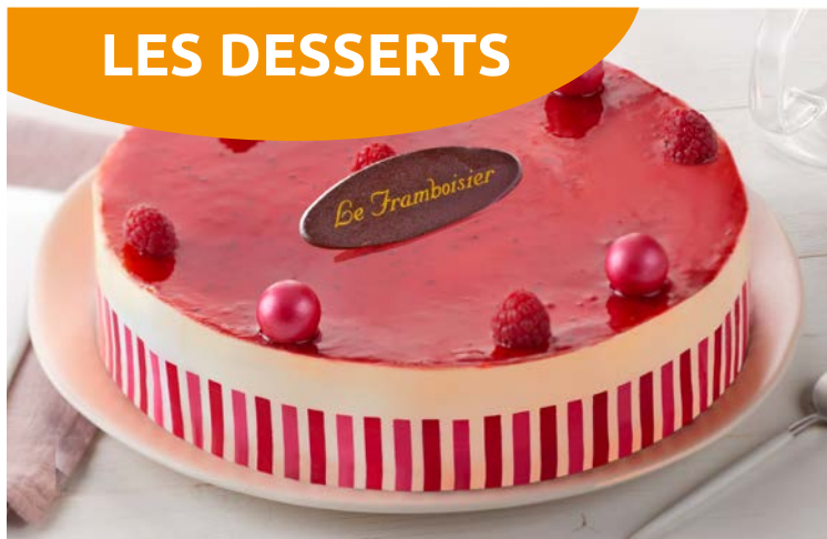
FRAMBOISIER 6 PARTS (m)