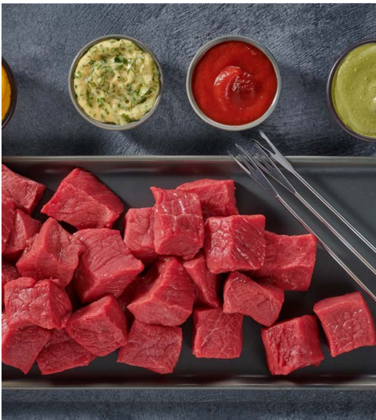
FONDUE CLASSIQUE POUR 4 PERSONNES (n)

L'assortiment de 800 g. Soit le kg : 21,25 €