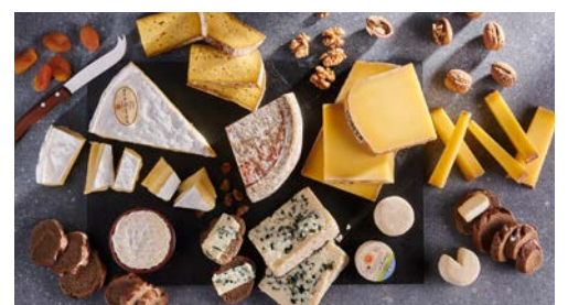
LES FROMAGES PAGES 34-35