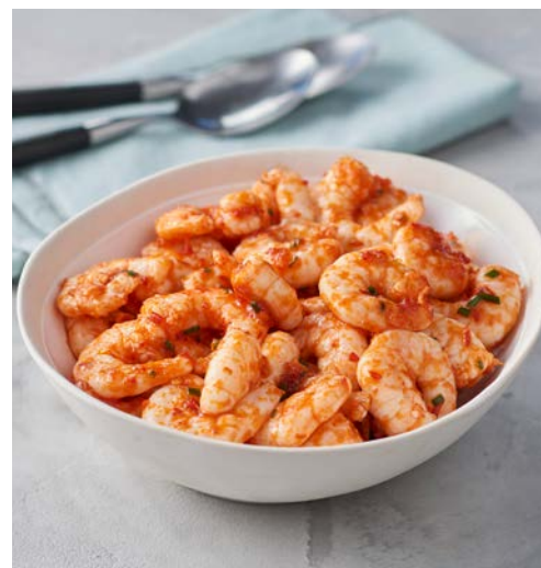
CREVETTES AU CURRY ROUGE (m)

Soit le kg : 12 € Au rayon Traiteur à la coupe