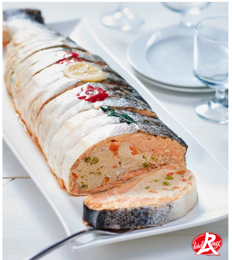
SAUMON ENTIER FARCI PETITS LÉGUMES LABEL ROUGE (m)

*Argopecten purpuratus (origine Pérou). Soit le kg : 17,50 € Au rayon Traiteur à la coupe