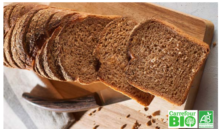
PAIN COMPLET (m) CARREFOUR BIO