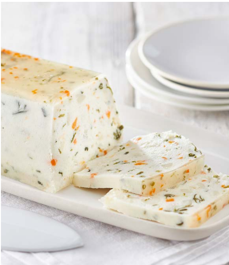
TERRINE DE NOIX DE ST JACQUES* (n)

Soit le kg : 14,90 € Au rayon Traiteur à la coupe