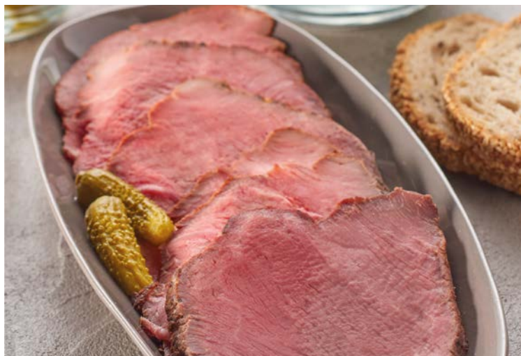
TRANCHES DE RÔTI DE BOEUF FROID

Les 2 tranches soit la part de 80 g environ. Soit le kg : 18,75 €