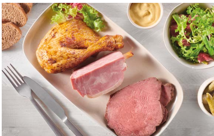
ASSIETTE DE VIANDE FROIDE POUR 1 PERSONNE (m)