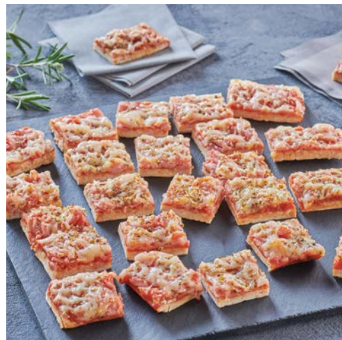
MINI PIZZAS JAMBON FROMAGE (m)

La barquette de 240 g. Soit le kg : 29,13 € Existe aussi en mini burgers au bacon.