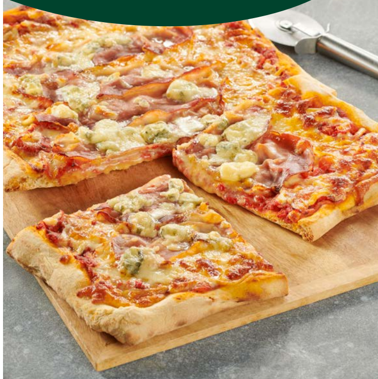
PIZZA TIROLESE (o)