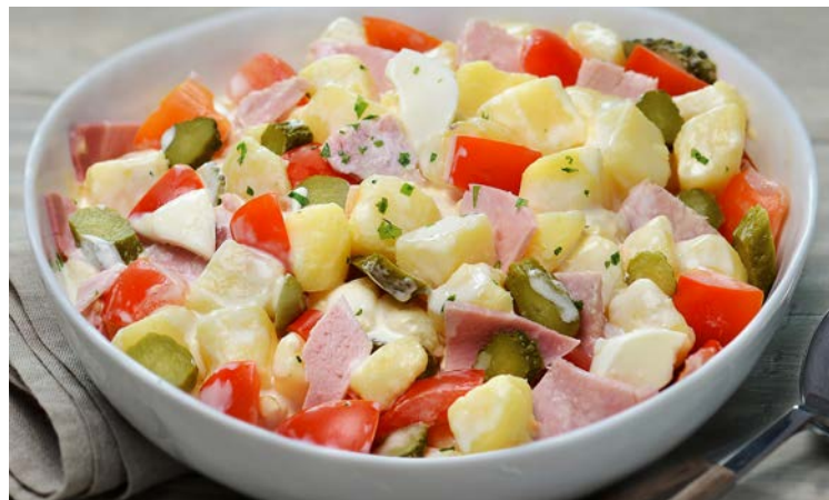
SALADE PIÉMONTAISE (m)

Soit le kg : 7,50 € Au rayon Traiteur à la coupe