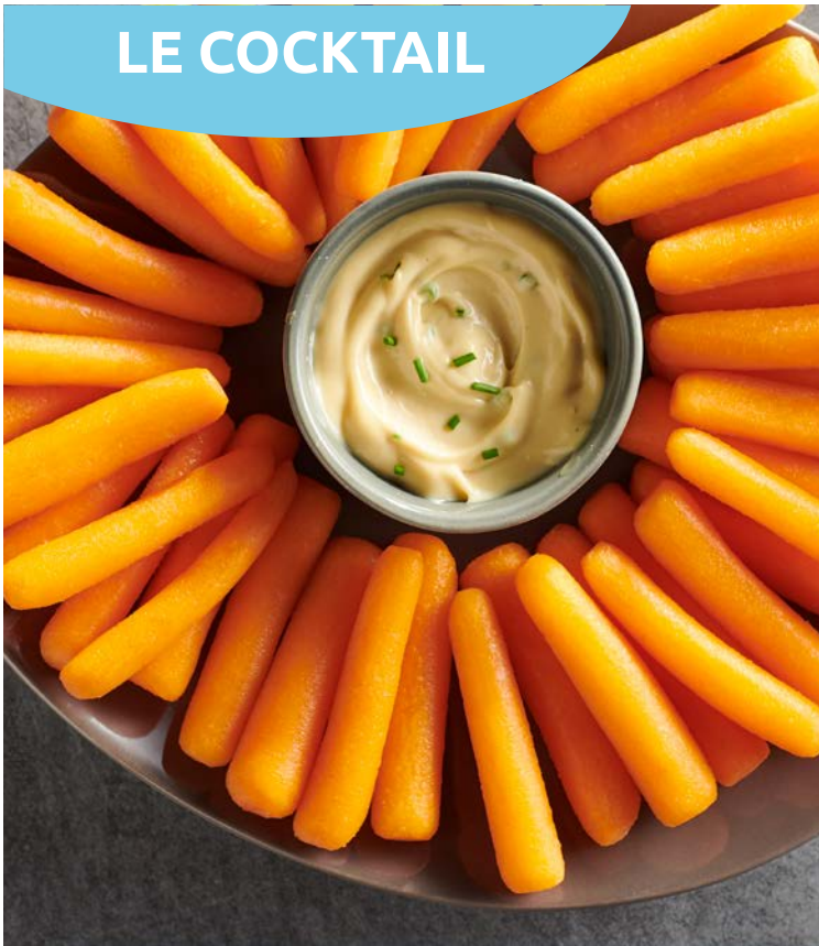
BABY CARROTS (m) FLORETTE