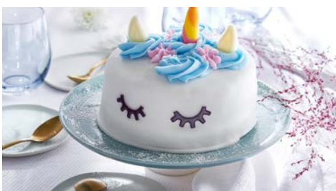
LES DESSERTS PAGES 36 à 41