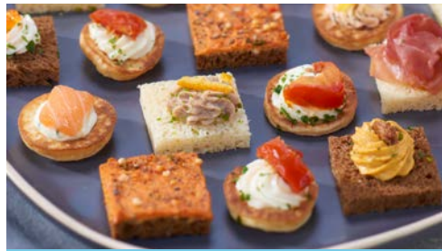
LE COCKTAIL PAGES 5 à 8