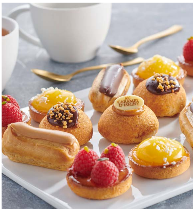
MINI GÂTEAUX LUNCH (m)

La boîte de 50 pièces - 350 g Soit le kg : 11,14 € Au rayon Boulangerie-pâtisserie