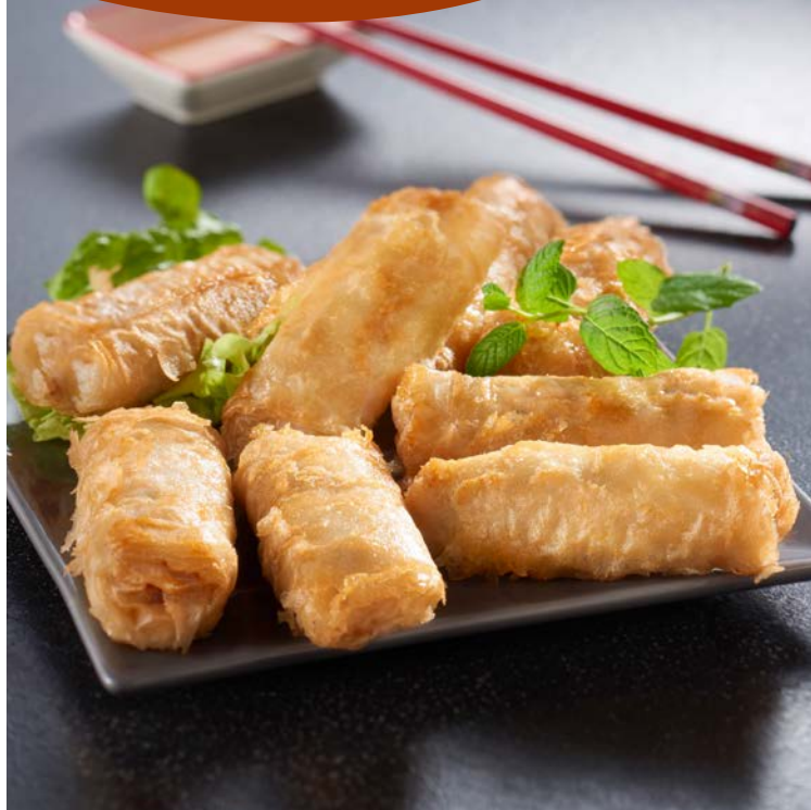
NEMS PORC OU POULET (m)