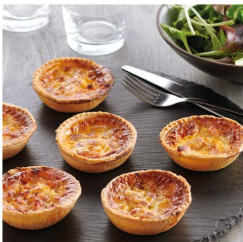
MINI QUICHE LORRAINE (m)

La barquette de 170 g. Soit le kg : 22,94 €