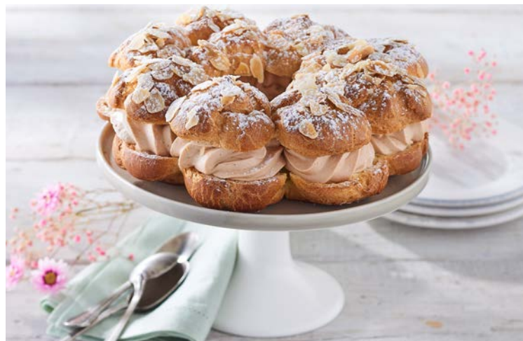
PARIS BREST 8 PARTS (m)

La pièce de 750 g. Produit décongelé selon les techniques appropriées. Ne pas recongeler. Soit le kg : 18,67 € Au rayon Boulangerie-pâtisserie