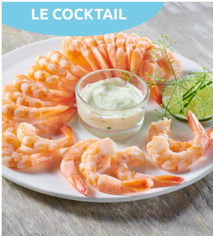
COURONNE DE QUEUES DE CREVETTES SAUCE FINES HERBES ASC CARREFOUR LE MARCHÉ (m)