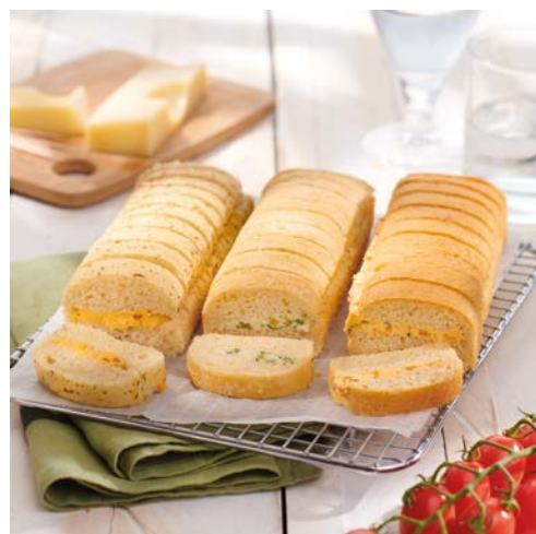
3 MINIS PAINS PRÉFOÛ RÉCEPTION (m)

La barquette de 6 pièces - 300 g. Soit le kg : 15,83 € Au rayon Traiteur libre-service