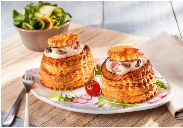
L'EXCELLENTE BOUCHÉE REINE (m)