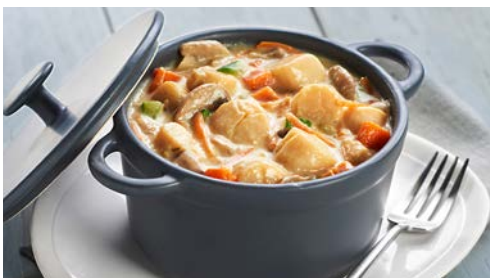
LES PLATS CUISINÉS PAGES 24-25