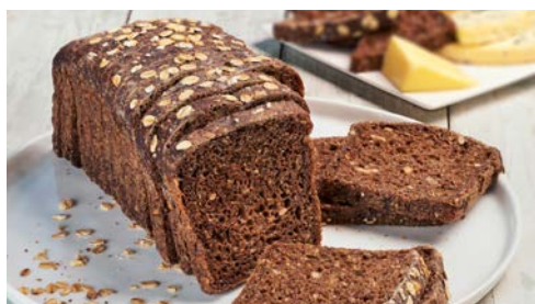
LES PAINS PAGE 33