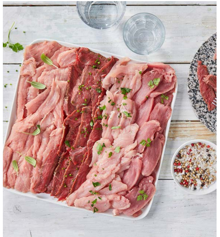
ASSORTIMENT POUR PIERRE À GRILLER EXTRA POUR 4 PERSONNES (n)

La barquette de 800 g. Soit le kg : 20 €