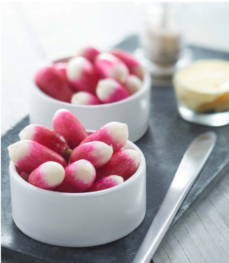
CROQ FRAIS RADIS (m) FLORETTE

Le plateau de 600 g. Soit le kg : 9,75 € Au rayon Fruits & légumes