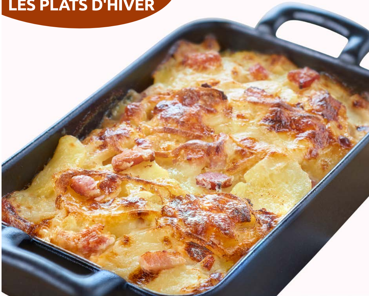
TARTIFLETTE AU REBLOCHON (m)