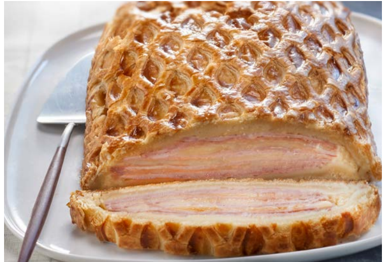
FEUILLANTINE COMTOISE (n)