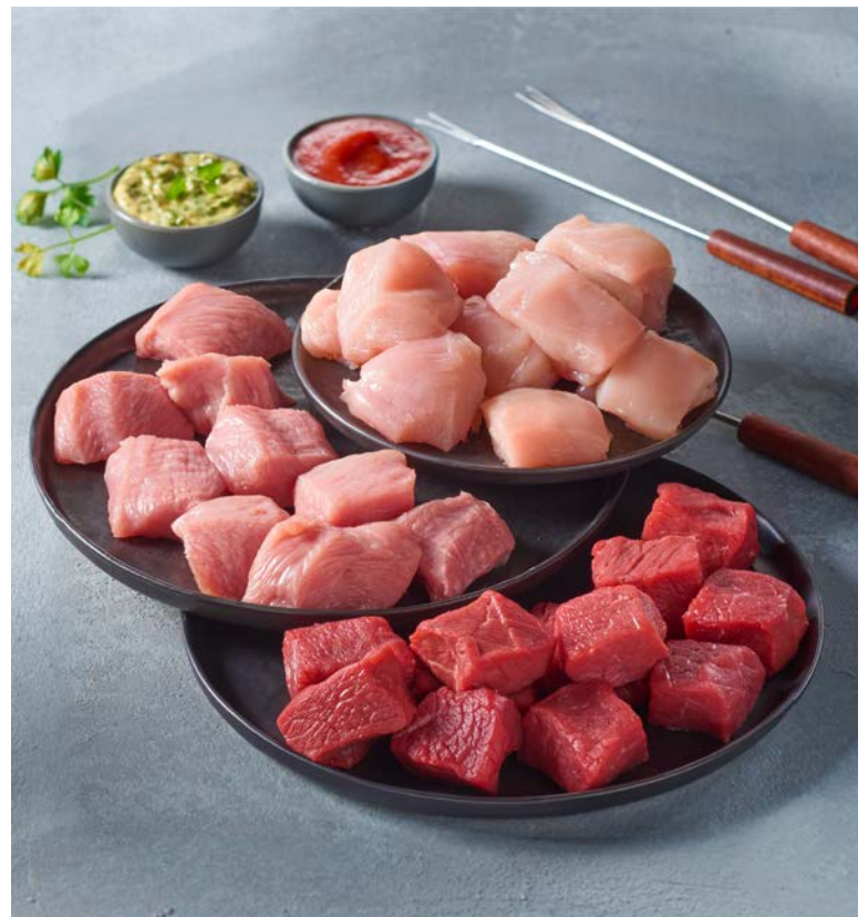
FONDUE MIXTE POUR 4 PERSONNES (n)

Viande pour fondue bourguignonne pour 4 personnes (800 g. environ). Composition : viande bovine pièce à fondue coupée en cubes. Soit le kg : 21,25 €