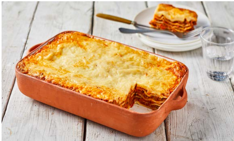
LASAGNES À LA BOLOGNAISE AU BŒUF CHAROLAIS (o)

Pour 6 personnes. La pièce de 1,2 kg. Soit le kg : 21,58 € Au rayon Traiteur à la coupe