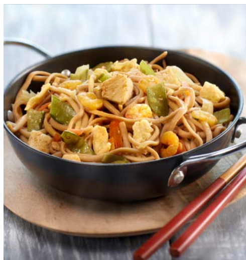
NOUILLES ROYALES (n)

Soit le kg : 7,50 € Au rayon Traiteur à la coupe