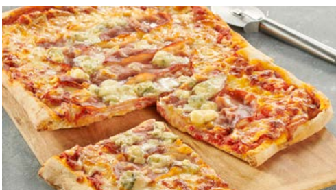
LES PIZZAS ET QUICHES PAGE 32