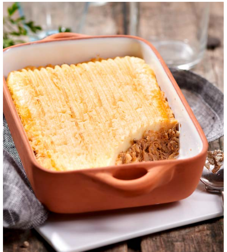
PARMENTIER DE CANARD (m)

La barquette 280 g. Soit le kg : 10,71 €