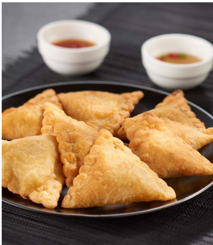
SAMOUSSA AU BŒUF (m)

La pièce de 75 g. Soit le kg : 9,33 € Au rayon Traiteur à la coupe