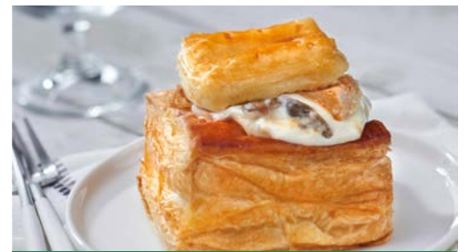
LES ENTRÉES PAGES 20 à 23