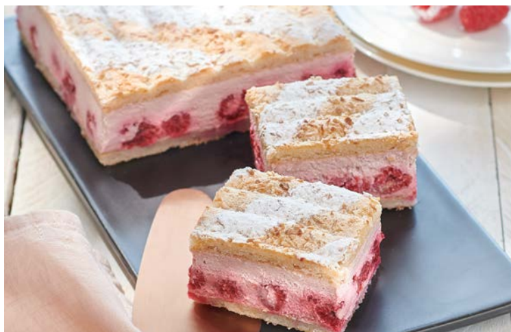
GÂTEAU MACARON FRAMBOISE 6/8 PARTS

La pièce de 610 g. Produit décongelé selon les techniques appropriées. Ne pas recongeler. Soit le kg : 19,59 € Au rayon Boulangerie-pâtisserie