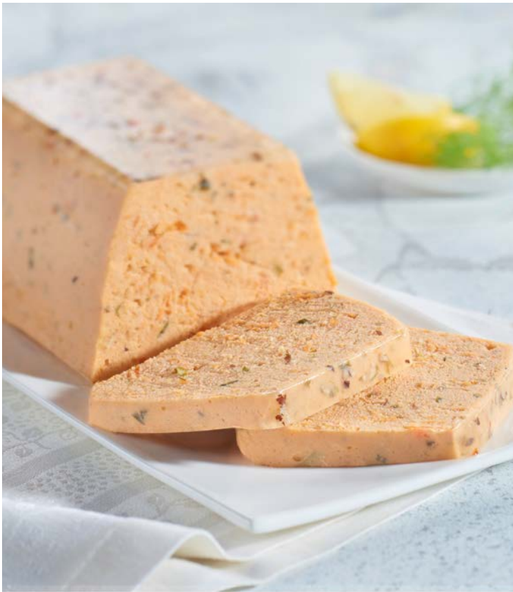
TERRINE AUX TROIS POISSONS (n)