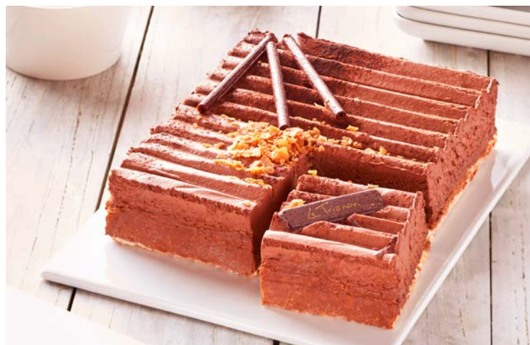
GÂTEAU CHOCOLAT TRIANON

La pièce de 665 g. Produit décongelé selon les techniques appropriées. Ne pas recongeler. Soit le kg : 14,89 € Au rayon Boulangerie-pâtisserie