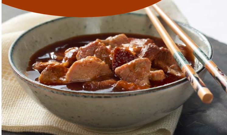
PORC AU CARAMEL (m)