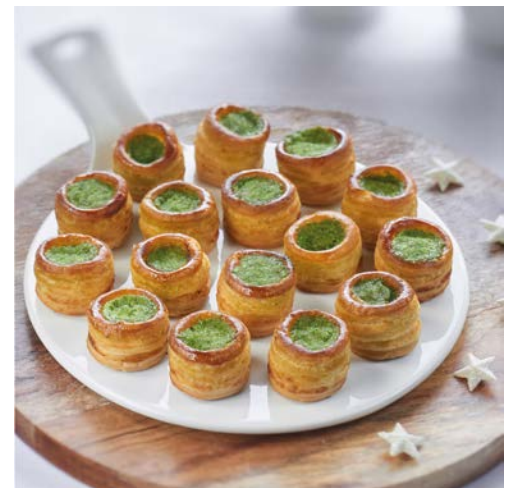
16 MINIS FEUILLETÉS D'ESCARGOTS RECETTE À LA BOURGUIGNONNE (m)

La barquette de 30 toasts - 450 g. Soit le kg : 17 € Existe aussi en toasts quiche lorraine Au rayon Traiteur libre-service