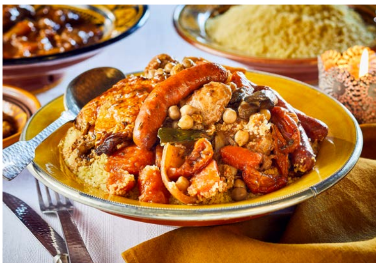
COUSCOUS ROYAL (n)

Soit le kg : 10 € Au rayon Traiteur à la coupe