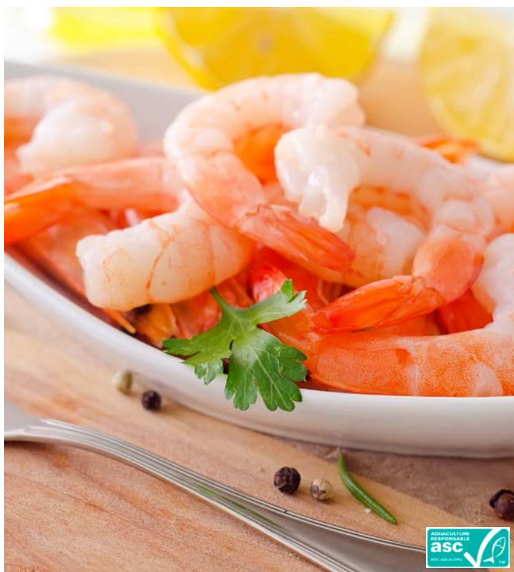
CREVETTES DÉCORTIQUÉES DE MADAGASCAR ASC (m)

La barquette de 160 g. Soit le kg : 38,75 € Au rayon Poissonnerie libre-service