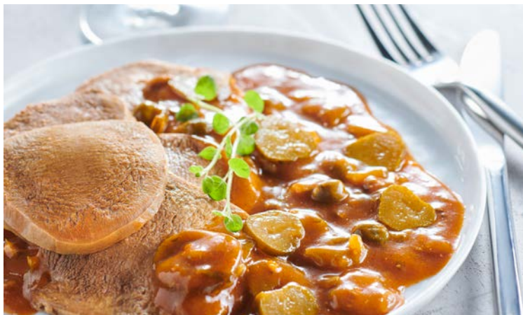
LANGUE DE BŒUF SAUCE PIQUANTE (n)

Soit le kg : 12 € Au rayon Traiteur à la coupe