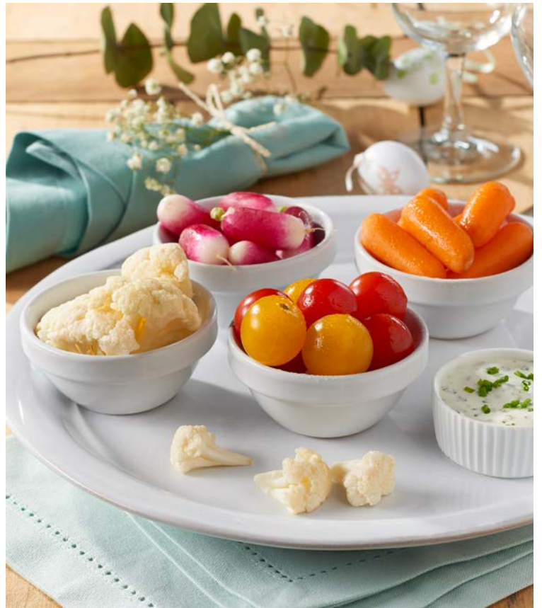
PLATEAU DE LÉGUMES APÉRITIF (m) FLORETTE

Le sachet de 450 g. Soit le kg : 6,44 € Au rayon Fruits & légumes