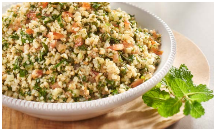
TABOULÉ À L'ORIENTALE (m)

Soit le kg : 6,20 € Au rayon Traiteur libre-service