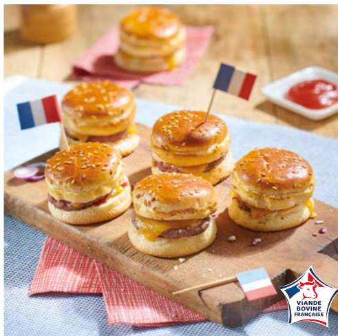
6 MINIS CHEESE BURGER AU BOEUF (m)

Jambon/fromage ou panachés. La barquette de 9 pièces - 315 g. Soit le kg : 22,38 €