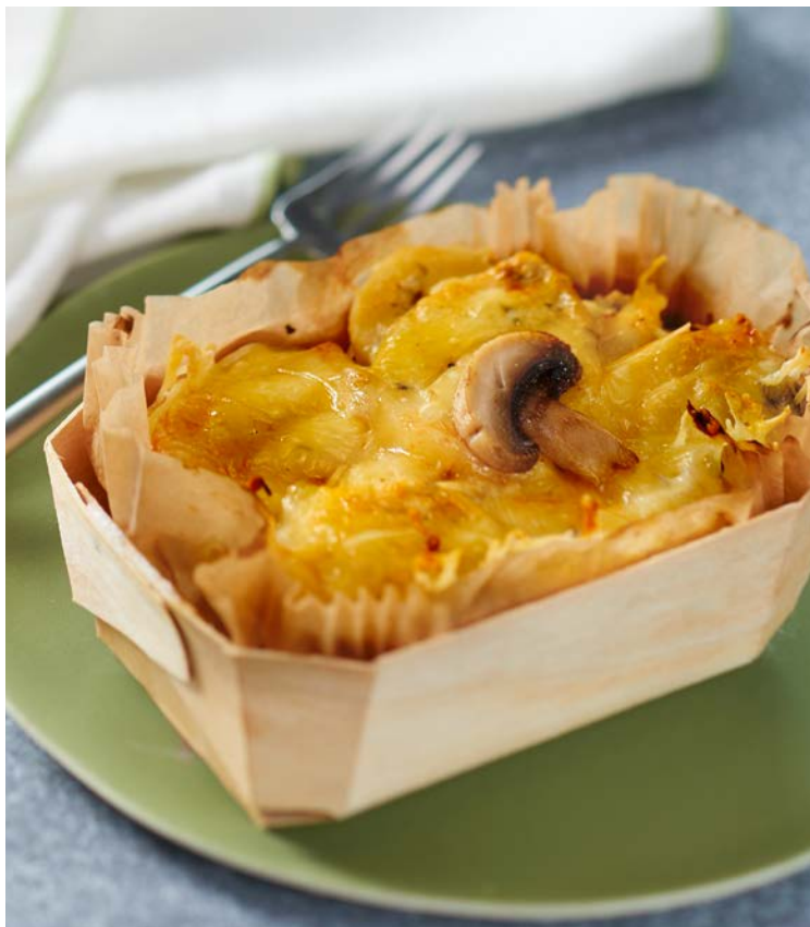
GRATIN AUX CHAMPIGNONS (n)