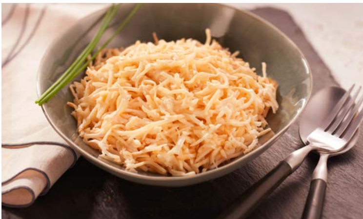
CELERI REMOULADE (m)

Soit le kg : 6,15 € Au rayon Traiteur à la coupe