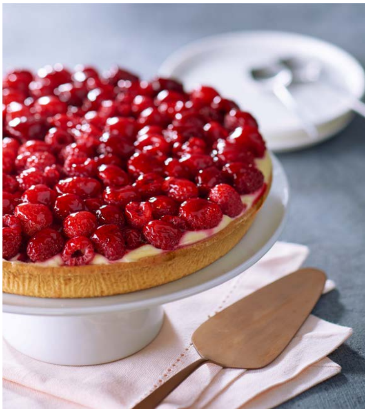
TARTE AUX FRAMBOISES 6 PARTS (m)