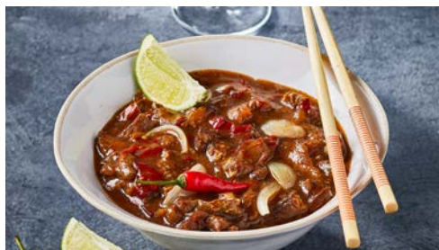
LES PLATS DU MONDE PAGES 26 à 29