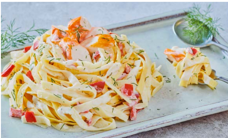
TAGLIATELLES AU SURIMI

Soit le kg : 6,20 € Au rayon Traiteur à la coupe