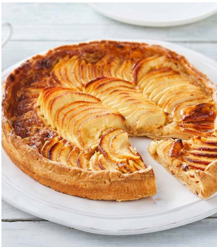
TARTE VERGEOISE POMMES 6 PARTS (m)

La pièce de 630 g. Produit décongelé selon les techniques appropriées. Ne pas recongeler. Soit le kg : 14,37 € Au rayon Boulangerie-pâtisserie